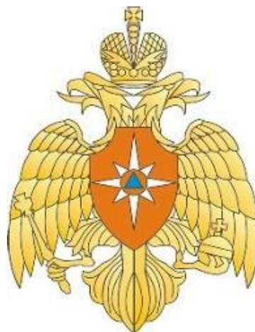
Большая эмблема МЧС

Победитель Областного конкурса «Модель школьных советов», 2009.